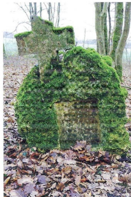
Grab in Gesnes-en-Argonne